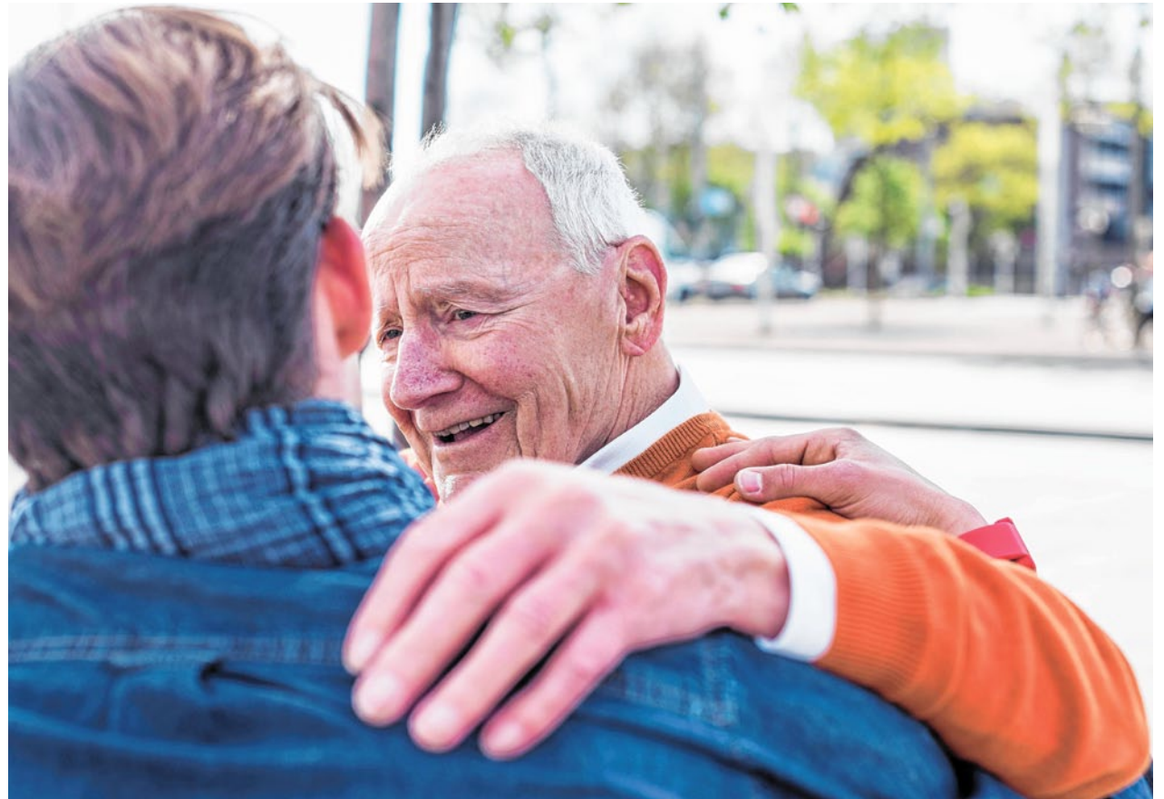
Pflege ist keine Privatsache: Für pflegende Familienangehörige soll es eine bis zu dreimonatige Freistellung vom Arbeitsplatz geben. In dieser Zeit erhalten sie eine Lohnersatzleistung in Höhe des Elterngeldes.

Um den Familien in unserem Land mehr Zeit füreinander zu geben, wird die SPD die Familienarbeitszeit mit Familiengeld einführen. Die Familienarbeitszeit ist ein Angebot für junge Eltern, die sich gemeinsam ums Kind kümmern und engagiert im Beruf sein wollen. Wenn Eltern ihre Arbeitszeit reduzieren möchten, erhalten sie das Familiengeld. Es beträgt jeweils 150 Euro