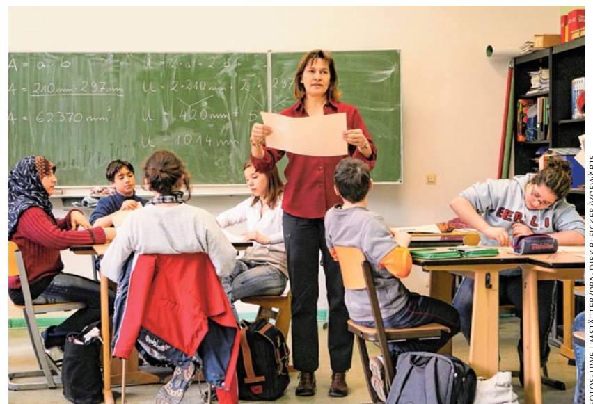
Die SPD will das Kooperationsverbot abschaffen: So kann der Bund gemeinsam mit den Ländern in beste Bildung investieren.

Die SPD will allen Kindern die Türen zu guter Bildung öffnen. Weder Geld noch Herkunft dürfen eine Rolle spielen. Deshalb machen wir Bildung gebührenfrei. Und zwar von der Kita über die Ausbildung und das Erststudium bis zum Master und zur Meisterprüfung. Damit schaffen wir gleiche Chancen und investieren in die Zukunft.