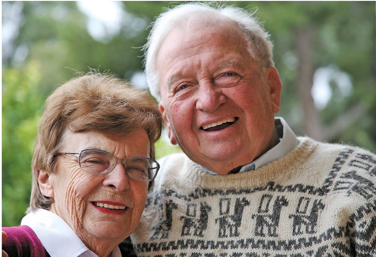
Die SPD sichert die Rente mit einer doppelten Haltelinie: Das Rentenniveau soll bei mindestens 48 Prozent liegen. Zugleich sollen die Rentenbeiträge die Marke von 22 Prozent nicht überschreiten.

lich ihre Steuern zahlen und andere ihre Steuern klein rechnen oder gar hinterziehen. Das verursacht Schäden in Milliardenhöhe für unsere Gesellschaft. Steuerbetrug, Steuervermeidung und Geldwäsche wird die SPD hart bekämpfen.