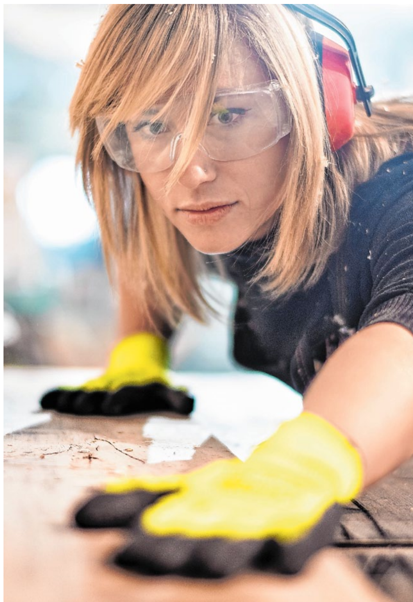
Immer mehr Jüngere bekommen nur befristete Jobs: Die SPD will die sachgrundlose Befristung abschaffen, um den Menschen Perspektiven und Planbarkeit zu ermöglichen.

Die SPD wird Geld in die Hand nehmen, damit es nach vorne geht. Unter den Industrieländern hat Deutschland eine der niedrigsten